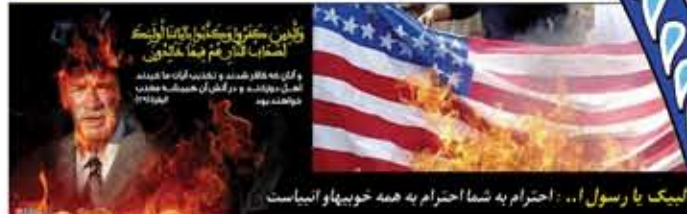
لیبیک یا رسول الله . احترام به شما احترام به همه خوبها و نیاهاست